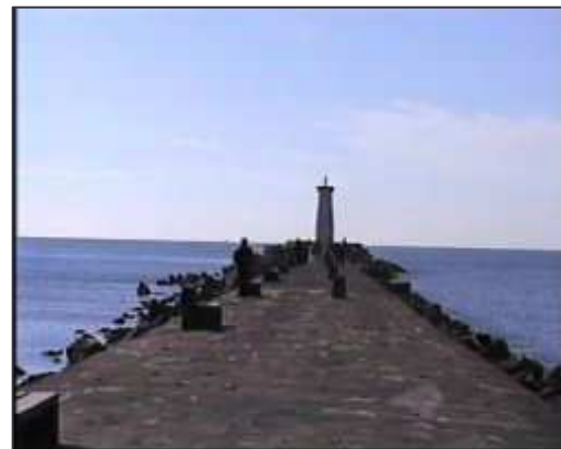
JETEE DU GRAU D'AGDE